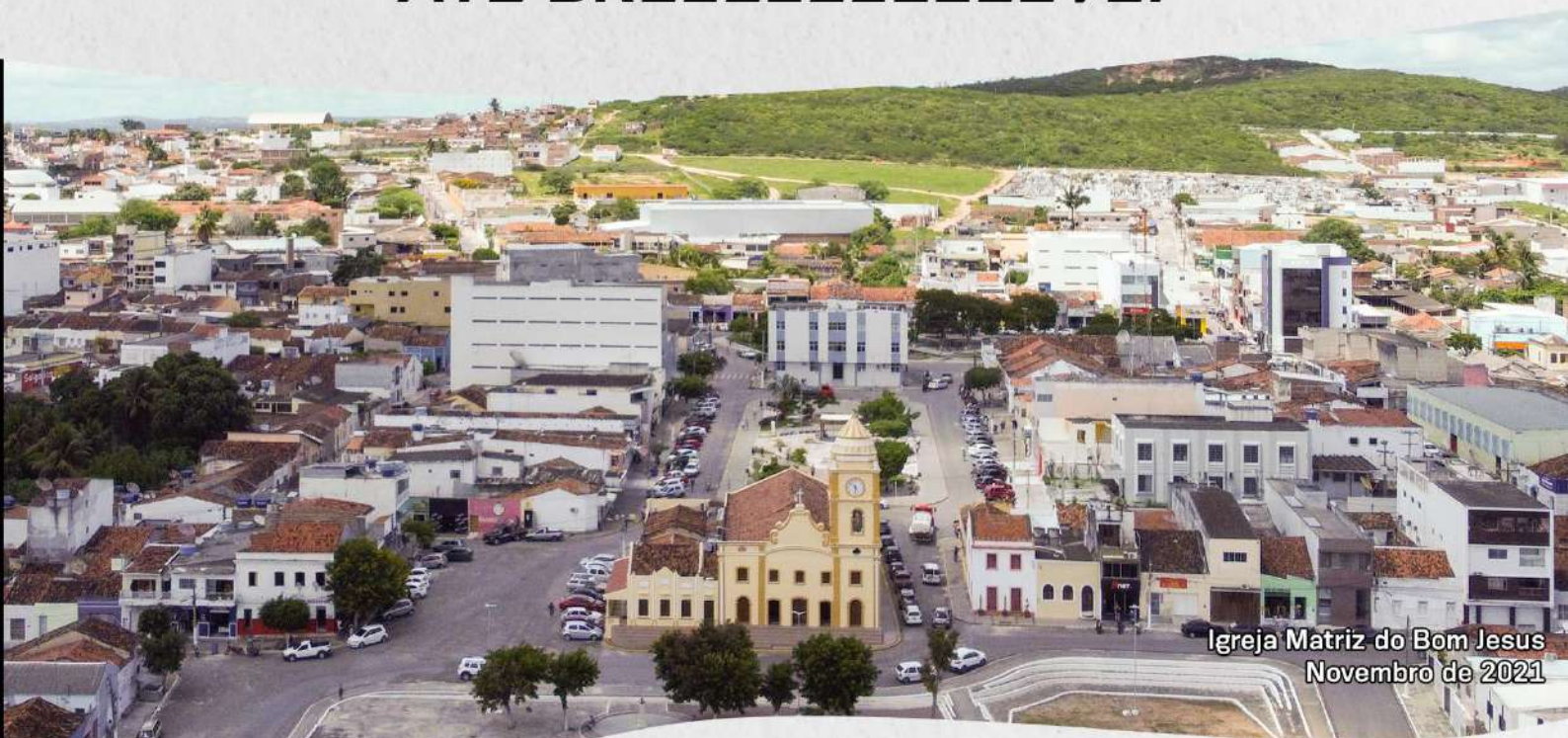
Igreja Matriz do Bom Jesus Novembro de 2021

Nos encontramos na próxima. ATÉ BREEEEEEEEEEVE!